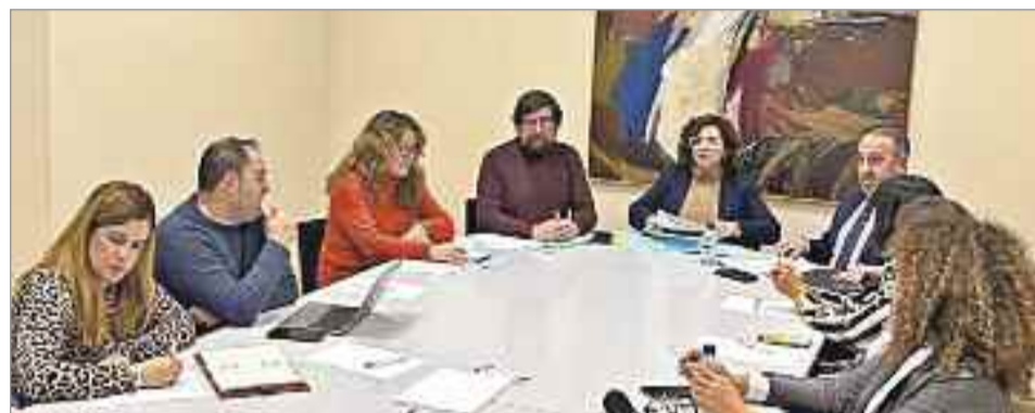
“El Consejo Local de Comercio es una de las primeras medidas puestas en marcha por el Plan Estratégico del Sector Comercial de Alcalá de Henares 2023-2027

sector comercial de la ciudad para satisfacer las necesidades de sus habitantes y de las personas titulares de los comercios. Por tanto, el Plan Estratégico de Comercio del Sector Comercial de Alcalá de Henares 2023-2027 tiene la misión de sentar las bases de una transformación en profundidad en el sector comercial de Alcalá de Henares, de forma