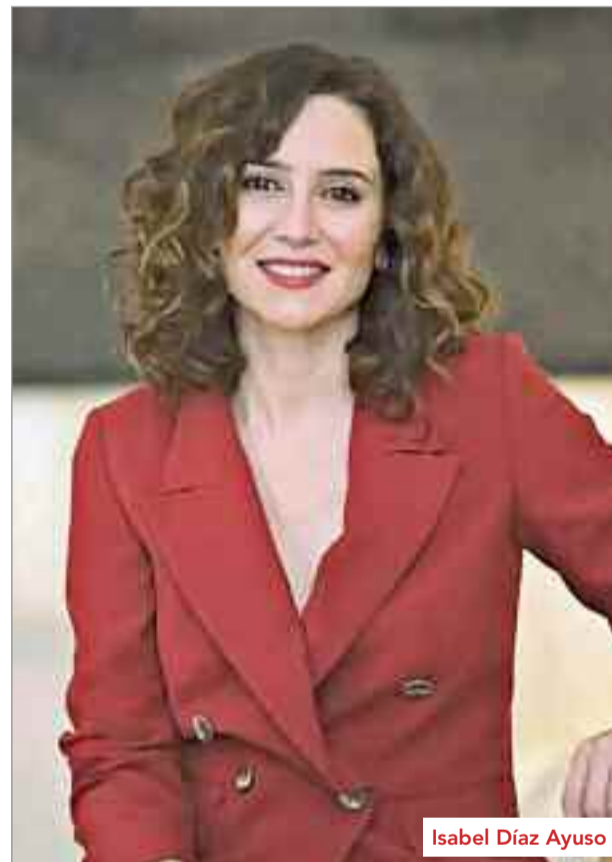
Isabel Díaz Ayuso

En la línea de fomentar la inclusión, como recordó la presidenta Díaz Ayuso, la Consejería de Familia, Juventud y Asuntos Sociales mantiene varios convenios entre los que destacan el firmado con Cruz Roja