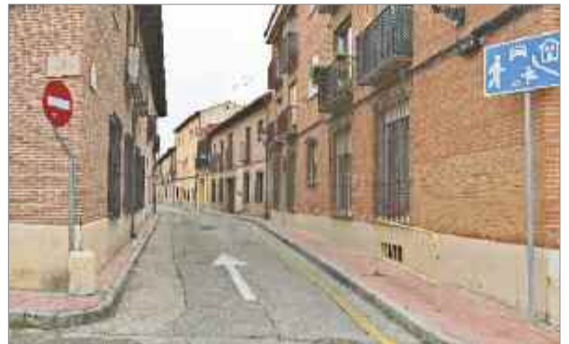
La propuesta tiene como objeto final la reparación, adecuación y mejora de la movilidad mediante el establecimiento de una plataforma única sin desniveles, con prioridad peatonal