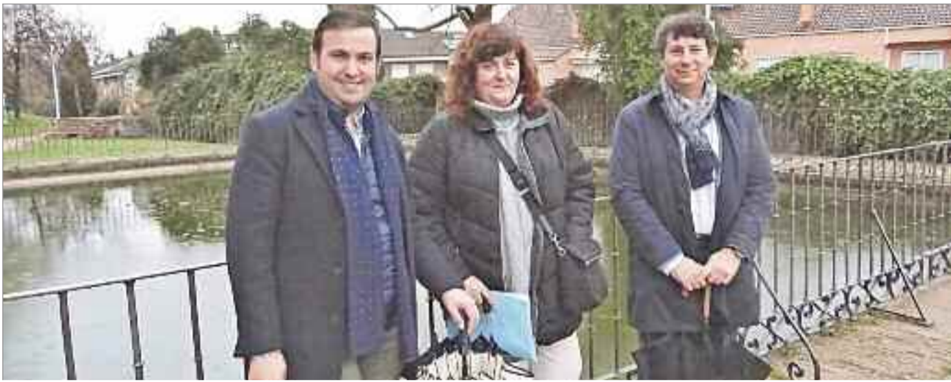
La alberca se ha llenado con el agua procedente del viaje del agua, una infraestructura hidráulica centenaria con la que cuenta este espacio.