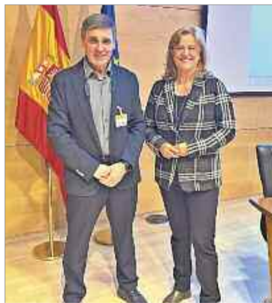
La secretaria de Estado de Turismo destacó las cifras récord de visitantes e ingresos en Turismo de España en 2023

Esta invitación de la Secretaría de Estado de Turismo, a través de SEGITTUR, se enmarca en el proceso de digitalización que está experimentando el sector turístico en España y muy en concreto la ciudad de Alcalá de Henares, miembro de la red de Destinos turísticos Inteligentes. El acto contó con la participación de la secretaria de Estado de Turismo, Rosana Morillo, y con la directora ejecutiva de la Organización Mundial del Turismo, Natalia Bayona. El manual aborda y difunde por primera vez con el suficiente nivel de detalle todos aquellos elementos teóricos y prácticos que conforman el Modelo DTI desarrollado por SEGITTUR, así como aquellos aspectos que forman