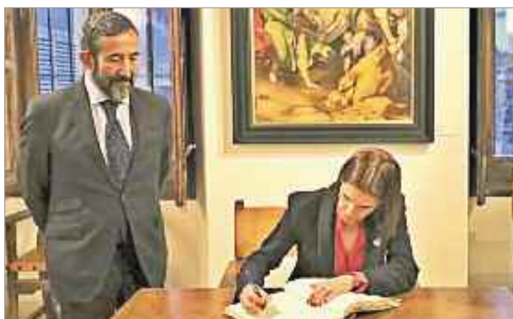
La alcaldesa de Alcalá firmó en el libro de honor de esta histórica institución