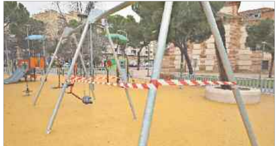
El motivo es que el suelo amable sobre el que se asienta este columpio no cumple con los requisitos técnicos de seguridad e impide la utilización del columpio por parte de los niños.

San Isidro, que el anterior Gobierno inauguró a bombo y platillo a pocas semanas de las elecciones. El motivo es que el suelo amable sobre el que se asienta este columpio no cumple con los requisitos técnicos de seguridad e impide la utilización del columpio por parte de los niños. “Esta zona infantil fue inaugurada por el ex alcalde Javier Rodríguez Palacios, acompañado por hasta cuatro concejales hace menos de un año. Esta es la herencia que hemos recibido, zonas infantiles que tenemos que clausurar porque ponen en peligro la seguridad de nuestros niños. Esta es solo una muestra más de las chapuzas que hemos heredado del PSOE y de las que seguiremos informando en las próximas semanas” , afirmó Pérez.