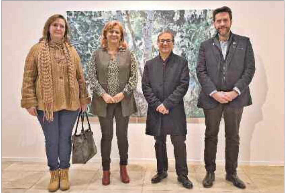
La exposición se divide en tres espacios: Las "Singeries", "El factor humano", "La mirada errabunda"

La mayor parte de los trabajos contienen figuras humanas, aunque también se aborda el paisaje. El comisario de la exposición, Luis Álvarez Falcón, ofrecerá una visita guiada gratuita a la muestra el sábado 3 de febrero, a las 18:00 horas. El horario es de lunes a sábado de 10:00 a 14:00 y de 16:00 a 19:00 horas, los domingos de 10:00 a 15:00 horas y los lunes permanecerá cerrado.