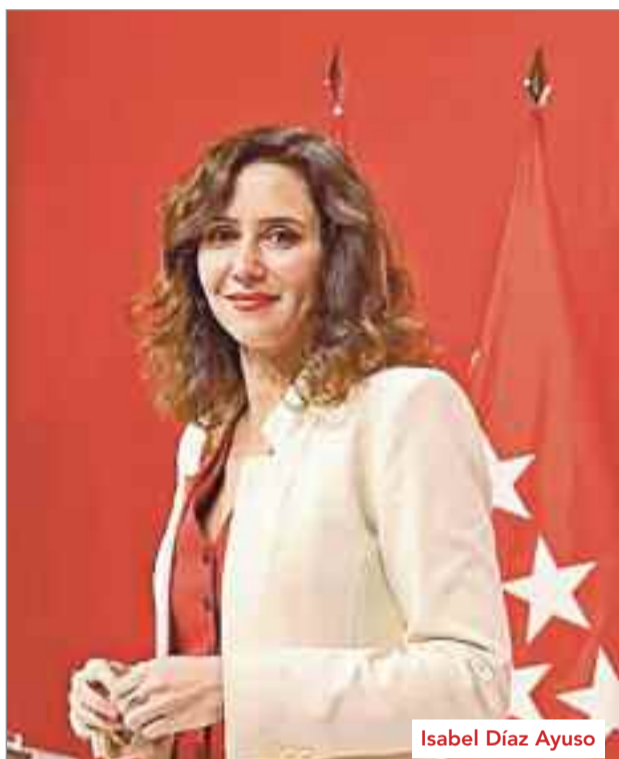
Isabel Díaz Ayuso

Por otro lado, en 2024, el Ejecutivo autonómico, junto al Ayuntamiento alcalaíno, iniciará los trabajos de viabilidad, valoración y planificación para la construcción de una nueva estación de autobuses, que beneficiará a los 200.000 vecinos de la ciudad. Su ubicación está por determinar, aunque se prevé que esté situada en el entorno del centro urbano para facilitar los desplazamientos de los ciudadanos. La Comunidad de Madrid continuará en 2024 desplegando sus inversiones destinadas a reforzar los servicios públicos del municipio alcalaíno. En este sentido, sobresalen los más de 5 millones de euros que el Ejecutivo autonómico dedica este año para distintas obras de mejora o equipamientos en las residencias Francisco de Vitoria y Cisneros o el centro de Mayores de Alcalá. Paralelamente, habrá 11,1 millones para financiar el mantenimiento de