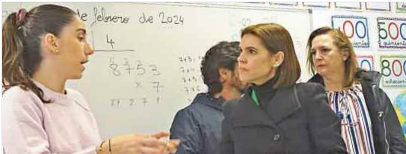
El objetivo fundamental es el de potenciar su aprendizaje y rendimiento escolar impartiendo clases semanales, a lo largo del curso escolar