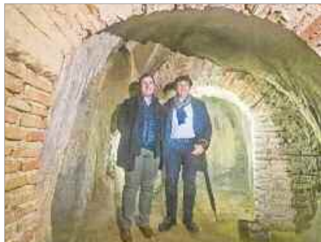
El estanque de Gilitos cuenta con unas dimensiones de 19 metros de largo, 12 metros de ancho y 3 metros de profundidad

El viaje del agua de Gilitos Durante la visita, también se ha podido conocer de primera mano la infraestructura del viaje del agua de Gilitos, que ha suministrado el agua al estanque de este espacio. Los viajes de agua son galerías subterráneas construidas para recoger el agua de lluvia acumulada en las capas de tierra permeable, más superficial, situadas sobre otras no permeables. A lo largo de su curso está formado por una serie de pozos, debidamente espaciados (20 a 80 metros), cuya profundidad se establece por los niveles de los diferentes estratos de tierras. La longitud de estas galerías subterráneas puede ser de varios kilómetros y aprovechan el desnivel del terreno para transportar el agua. Las investigaciones llevadas a cabo hasta el momento han dado como resultado la constatación de la existencia de varios viajes de agua en Alcalá, como el