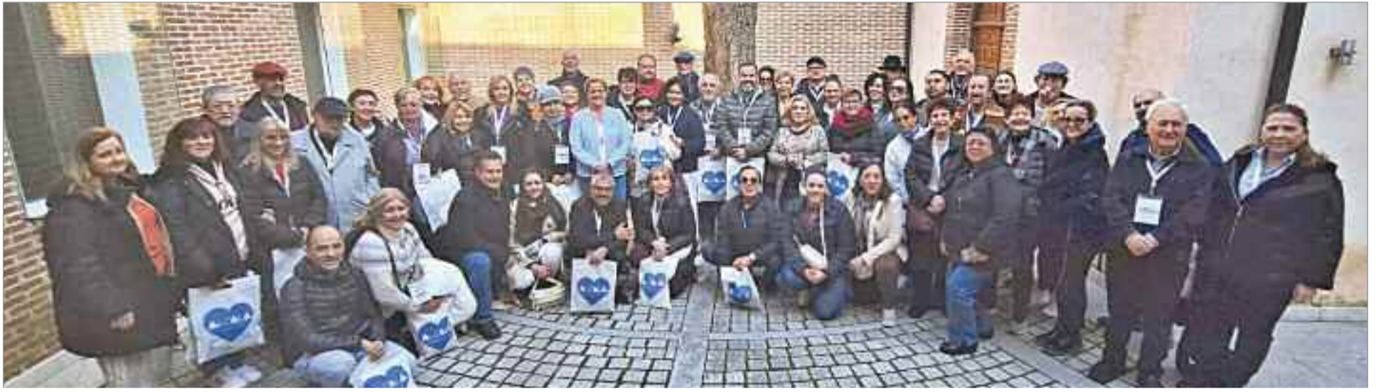
El objetivo de este tipo de encuentros es establecer contactos comerciales con diferentes turoperadores nacionales e internacionales, para dar a conocer in situ los atractivos de Alcalá de Henares