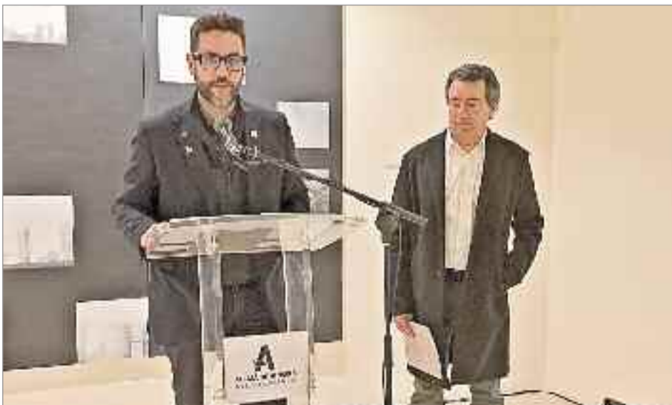
Se trata de "Impenetrable", una muestra que recorre parte de la obra de Alberto Capón,

Semblanza del artista Alberto Capón nació en Madrid en el año 1968. Su obra figura en diferentes museos y colecciones, entre otros, el Museo de Arte Contemporáneo de A Coruña, MUBAG de Alicante, Colección del Ayuntamiento de Alcobendas, Colección de arte Ayuntamiento de Alcalá de Henares, Museo Rafael Zabaleta de Quesada (Jaén), Colección de arte contemporáneo Ciudad de Pamplona, Colección Ayuntamiento de Almería, Colección Ayuntamiento de Madrid, Centro de la Artes de Alcorcón y Biblioteca Nacional de Madrid.